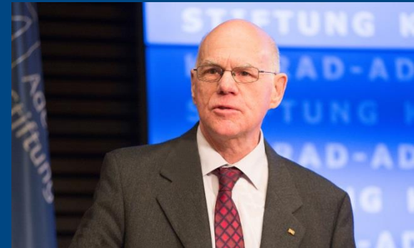
Vorsitzender: Prof. Dr. Norbert Lammert